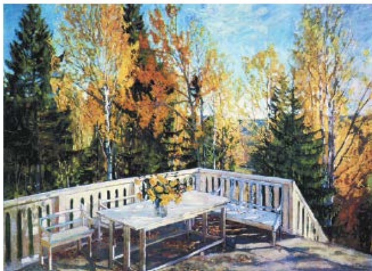
С. Ю. Жуковский. Веранда. Осень