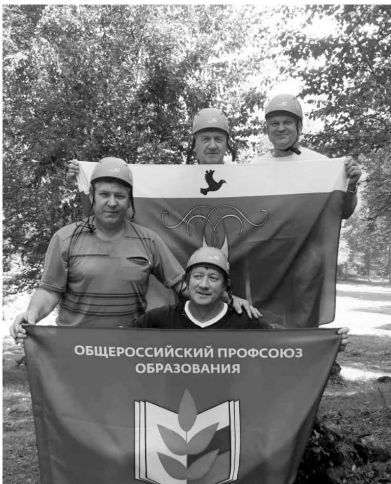
Учителя физической культуры Грачевского района