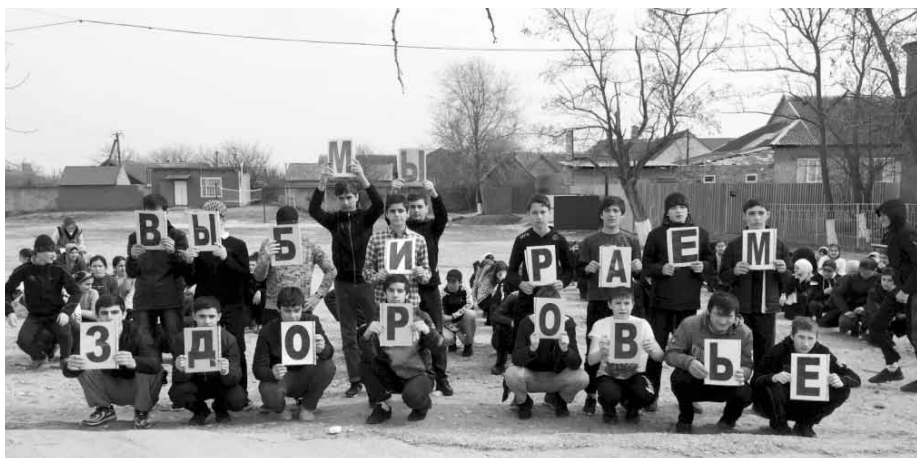
Флешмоб «Мы выбираем здоровье» в Хасавюртовском районе