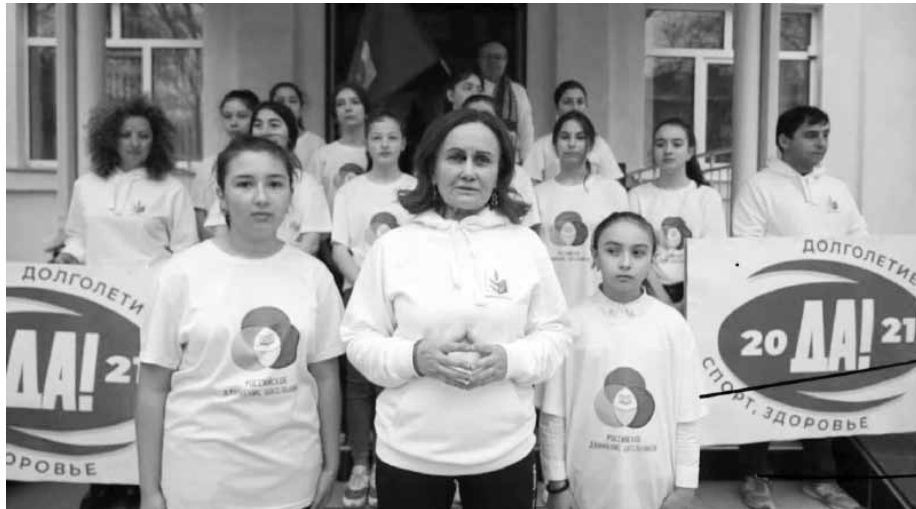
Всемирный день здоровья в республиканской организации профсоюза

Так, 7 апреля во всех образовательных учреждениях Карачаево-Черкесии прошла Всероссийская эстафета здоровья. Работники отрасли вышли на утреннюю зарядку и производственную гимнастику. Помимо территориальных и первичных организаций профсоюза, к акции присоединились социальные партнеры - Мини-