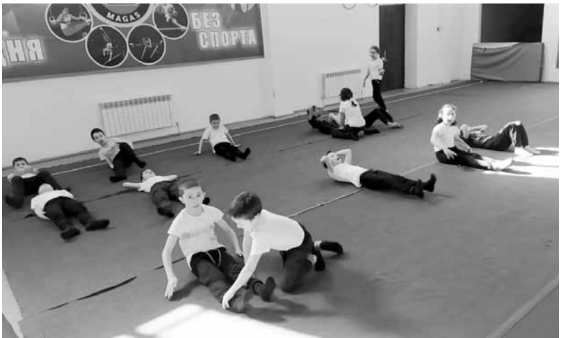
К эстафете здоровья присоединились школьники

В соответствии с республиканским планом мероприятий тематического года в период зимних каникул были орга-