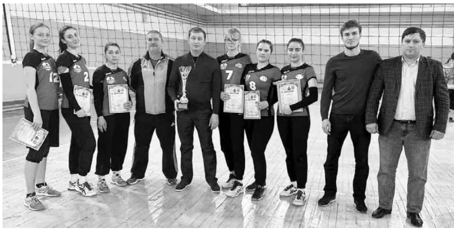
Участники студенческой спартакиады в ДГУ