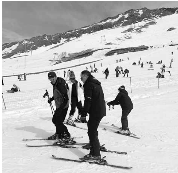
Педагоги встали на лыжи

Конечно, неотъемлемая составляющая здорового образа жизни - полноценный отдых. Потому ежегодно Ингушская республиканская организация